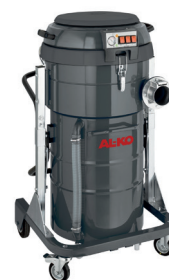
JS DM 3 M